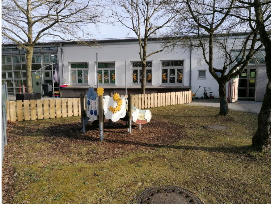
Bild 4 - Krippengarten

Damit dieser Schritt gut gelingt bieten wir folgende Unterstützung: