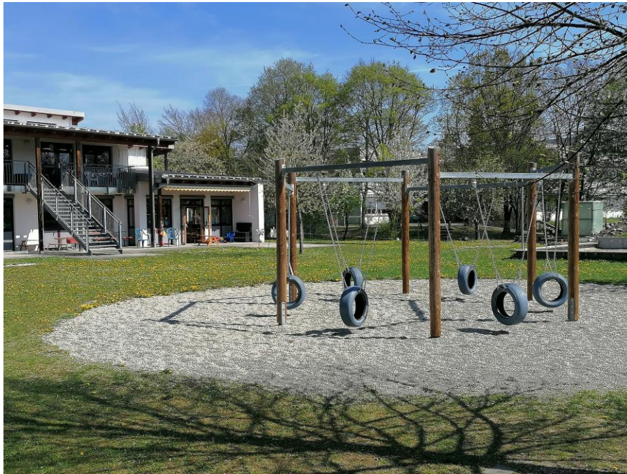
Bild 1 - Außenansicht Garten