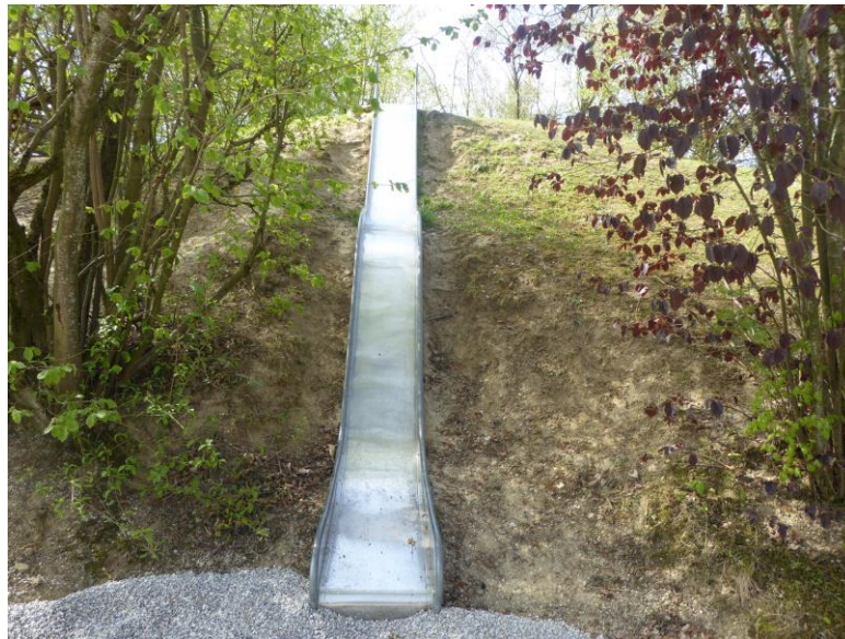
Bild 5 - Rutsche Kindergarten

Bei Krippenkindern kann es leicht zu Verschlucken kommen. Bitte verzichten Sie auf kleine Haarklammern oder sonstige Kleinteile. Sie liegen schnell herum und werden für alle zur Gefahr.