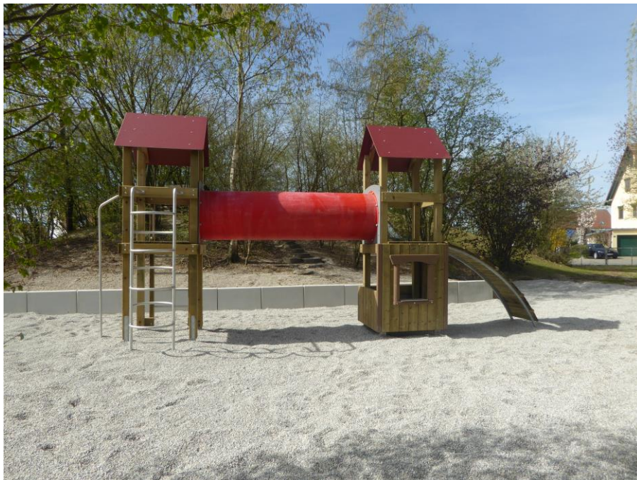
Bild 3 - Spielgerüst Kindergarten

„Hilf mir es selbst zu tun“ ist wohl der bekannteste Satz der Maria Montessori. Er drückt aus, wie es gelingt Kinder auf dem Weg zu mehr Selbständigkeit zu unterstützen.